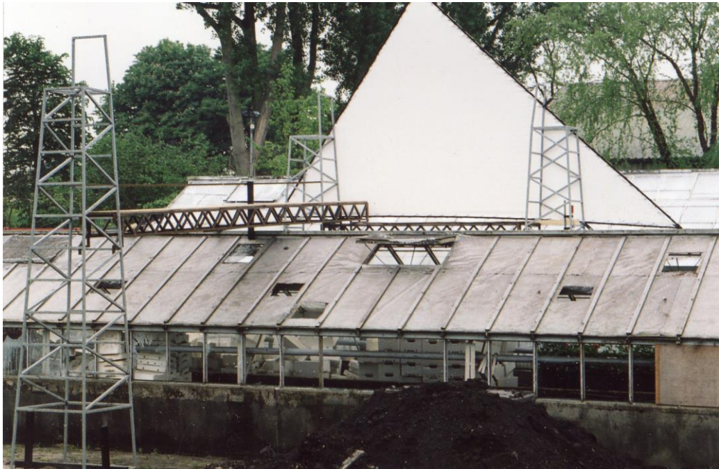
Kunstprijz Eenvoudige Vrouwen (2001)